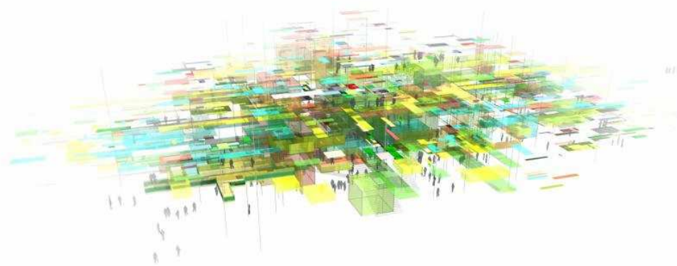
ООО «А-Б Студия» – «Облако» (91011)