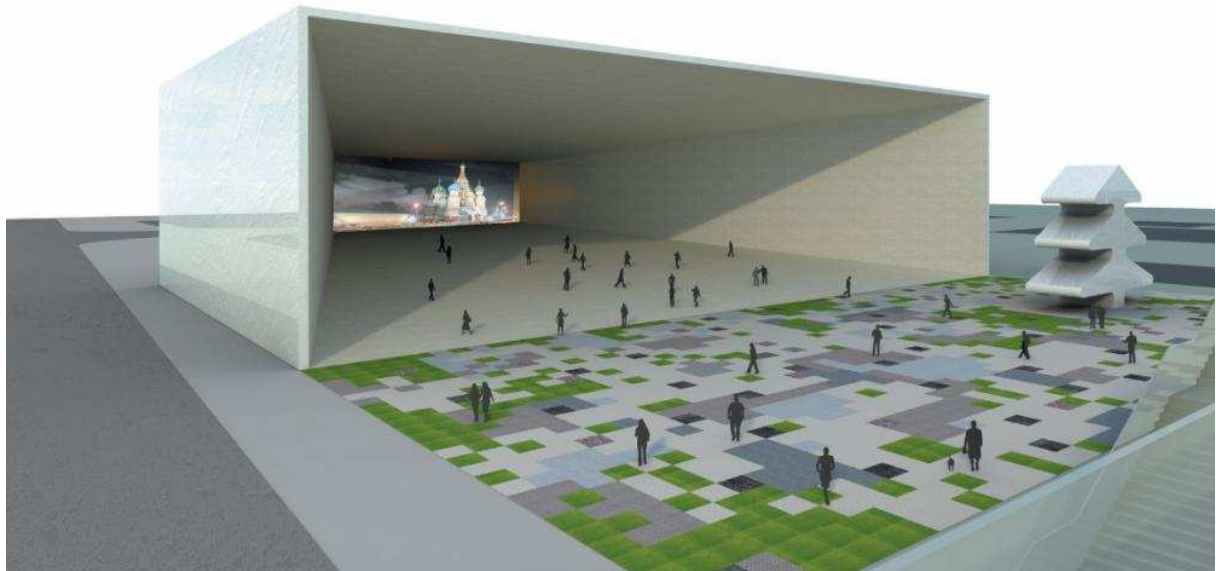
ВугоMoscow architects («БЮРО») – проект «Окно в Россию» (18122)