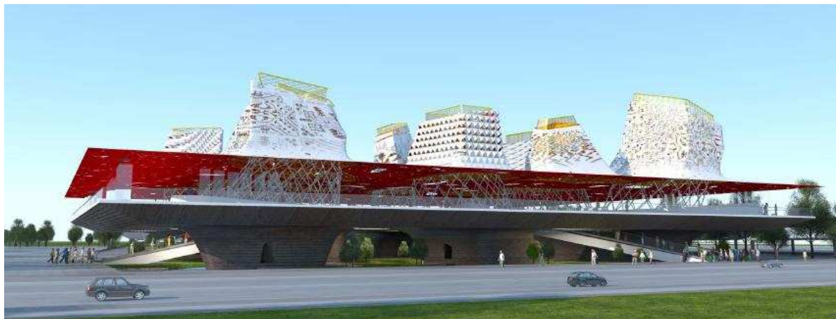
Архитектурное бюро "PAPER team architects" – «Буян-град. Города и легенды» (94173)