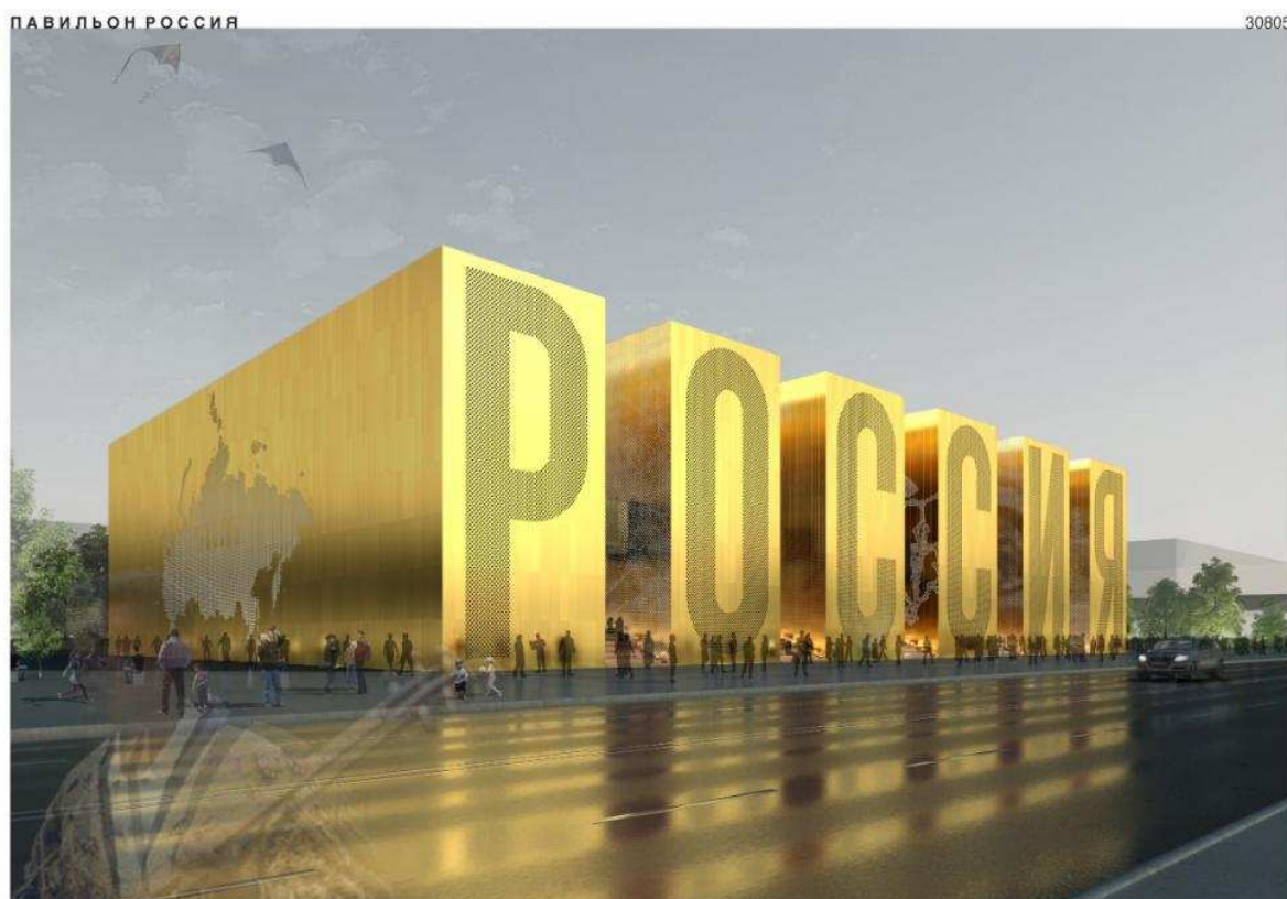
ООО «БЕРНАСКОНИ» – проект «РОССИЯ» (30805)